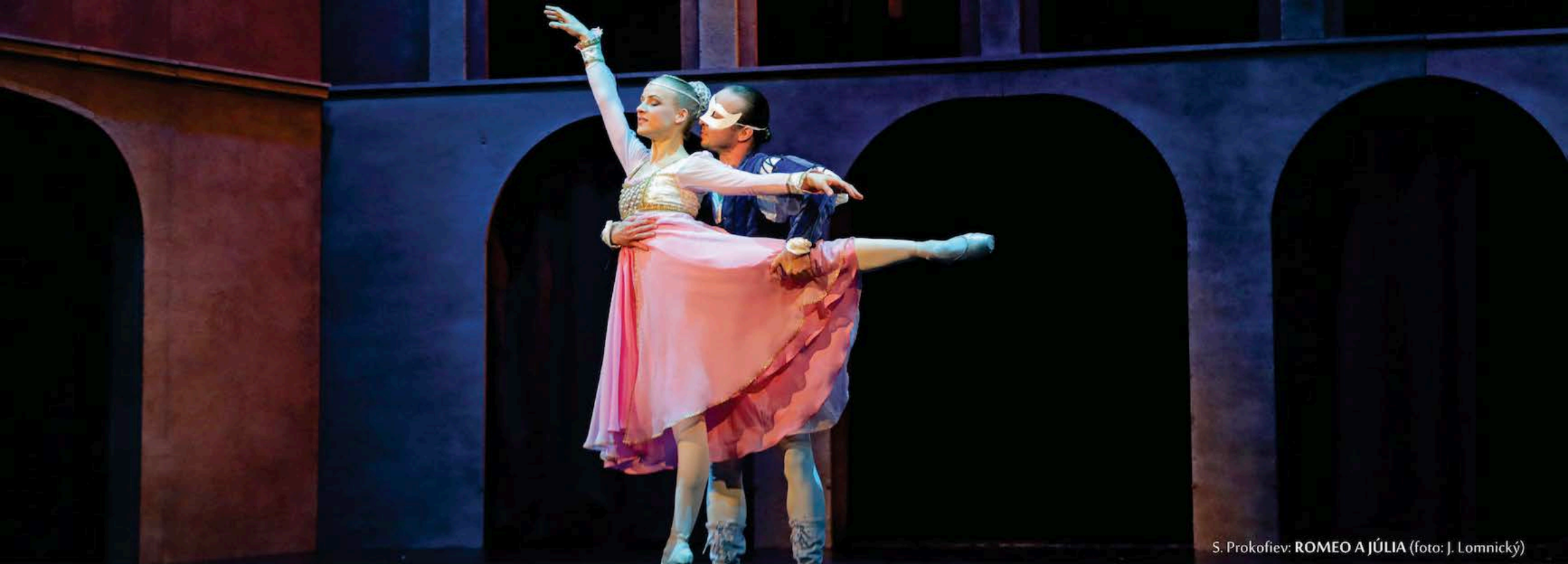
S. Prokofiev: ROMEO A JÚLIA