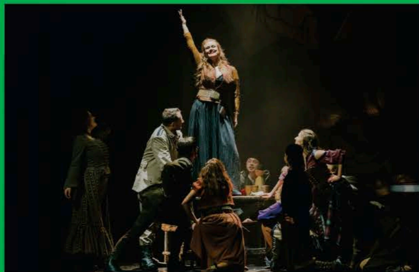
G. Bizet: CARMEN