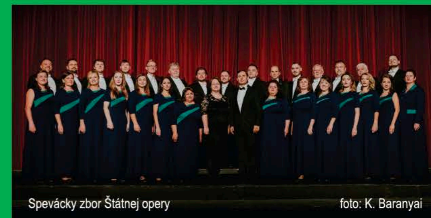
Spevácky zbor Štátnej opery