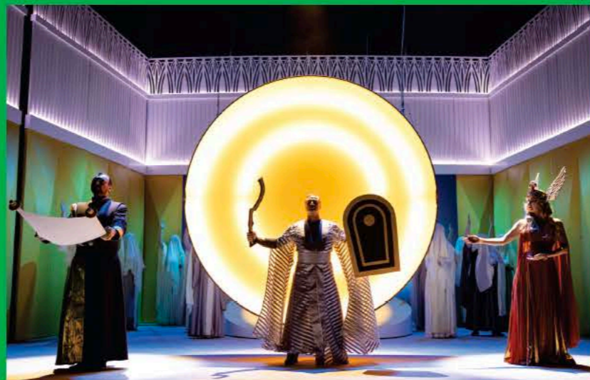
G. Verdi: AIDA